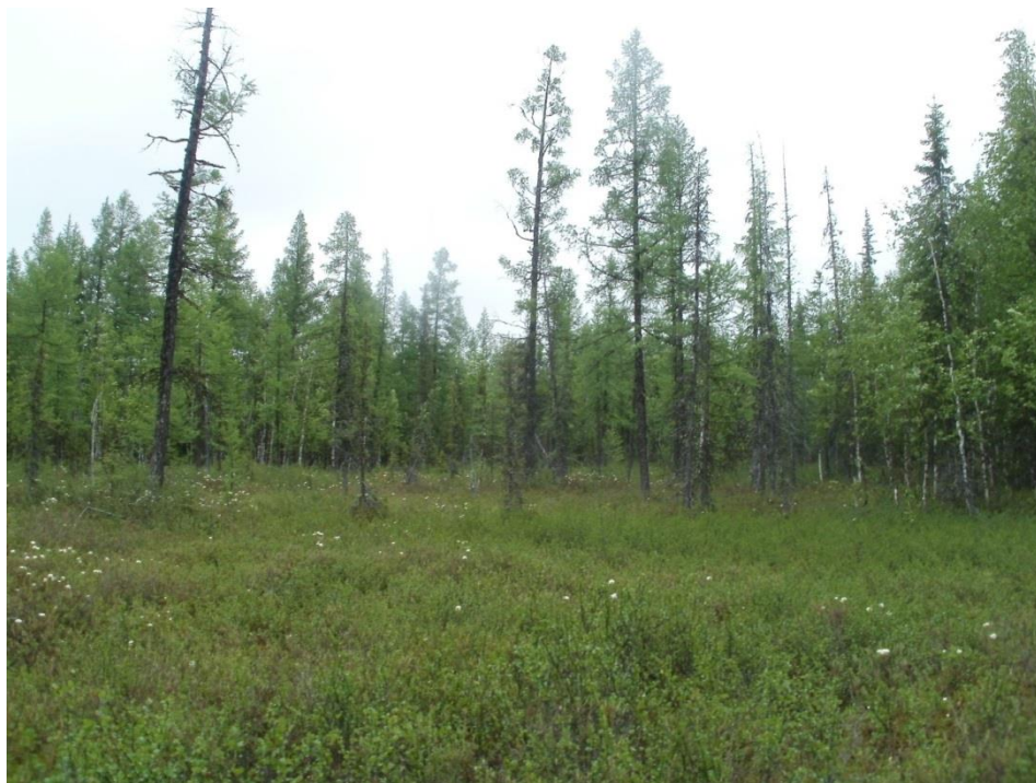
Рисунок 4 — Берёзово-лиственничный кустарничково-мохово-лишайниковый лес в районе проектируемой скважины №498

tum bipinnatum . Лишайники произрастают мозаично и представлены Cetraria cucullata , Cladina arbuscula , Cladonia fimbriata , Stereocaulon paschale .