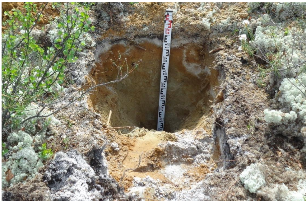
Рисунок 4 — Подзолы иллювиально-железистые в районе проектируемой скважины № 487

Почвы участков изысканий являются малопродуктивными, характеризуются низкой обеспеченностью основными питательными элементами, высоким окислительно-восстановительным потенциалом.