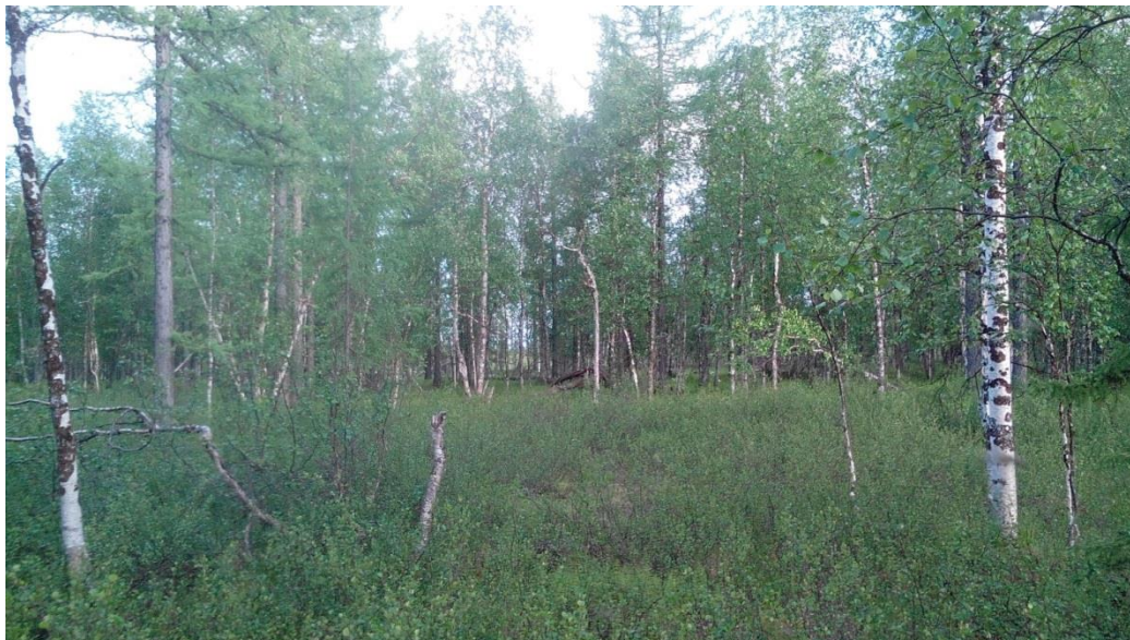
Рисунок 5 — Лиственничник с ольхой кустарничко-мохово-лишайниковый в районе проектируемой скважины № 487

В ходе полевых инженерно-экологических изысканий на территории земельного отвода под проектируемые объекты, а также в километровой зоне влияния виды растений, занесенных в Красные Книги Российской Федерации и Ямало-Ненецкого автономного округа не обнаружены.