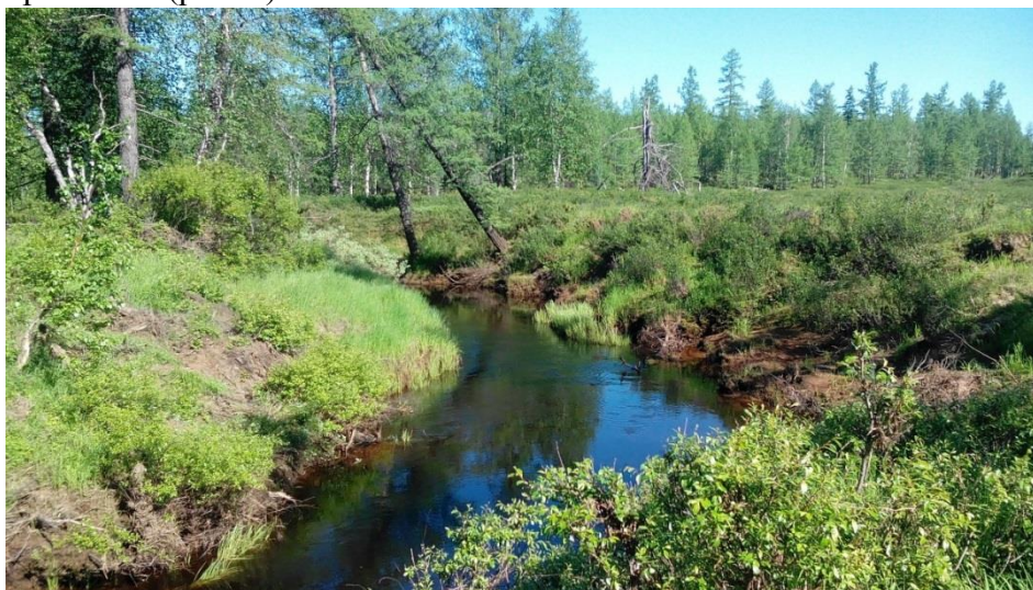
Рисунок 3 - Район перехода зимней подъездной автодороги к площадке скважины № 487 через реку Хэрнесьяха

Также проектируемая подъездная зимняя автодорога к площадке скважины № 487 пересекает реку Хэрнесьяха (рис. 3).